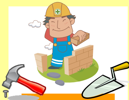
工事内容と建設業許可