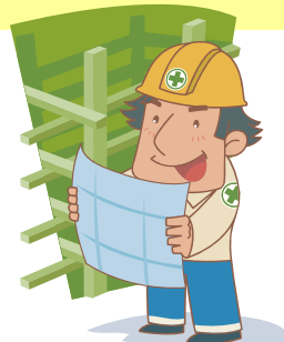
配置技術者の 氏名と資格